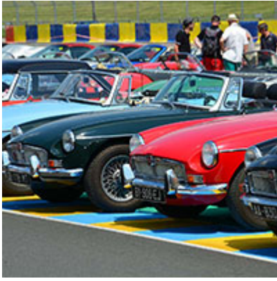
6 au 8 juillet Le Mans Classic