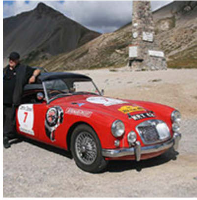
2 au 7 septembre MG Rallye des Alpes