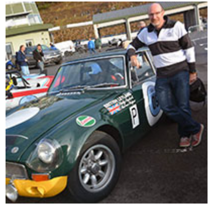
22 et 23 septembre Charade Heroes - MG Sport