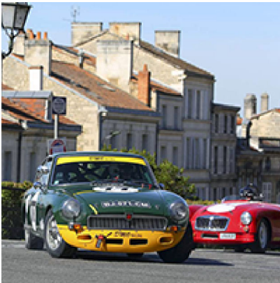
14 au 16 Septembre Le circuit des remparts