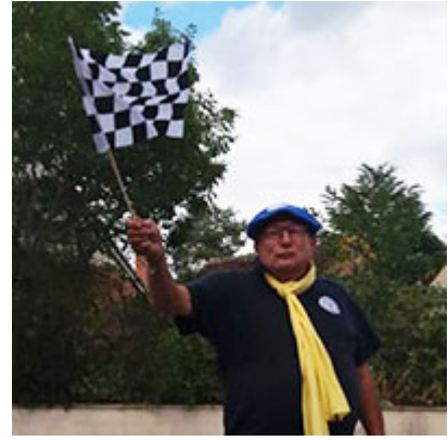
7 au 9 septembre Rallye du Petit Solognot