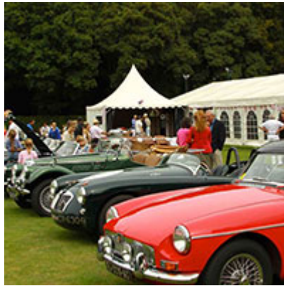
16 septembre Standard Athletic Club de Meudon