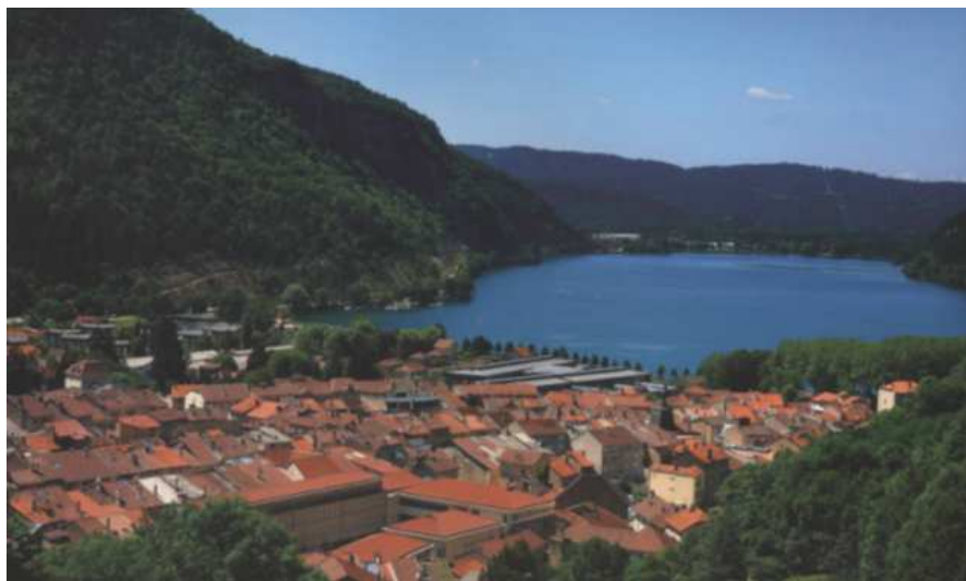
Nantua et son lac