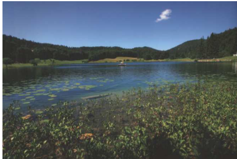
Le lac Genin