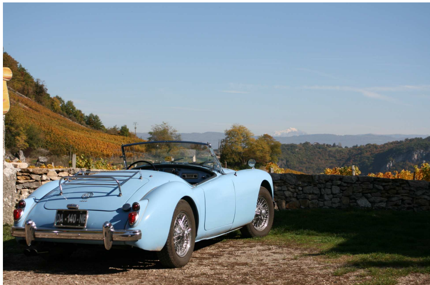
Le Mont Blanc depuis la route du Manicle