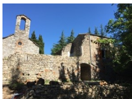
D317 - Cézas 30440 Sumène