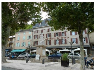
Grand Hôtel de France

Au Grand Hôtel de France, ancien relais de poste du XVIIe. Tenu par la famille Cordelier depuis 1946.