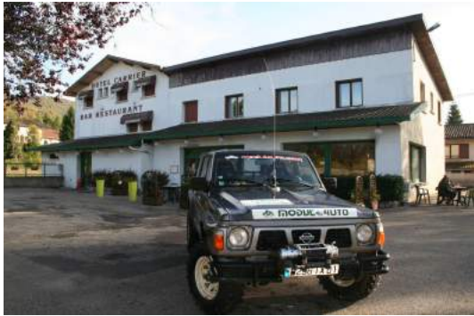
Hôtel – restaurant CARRIER à Labalme Tél : 06 86 88 31 88