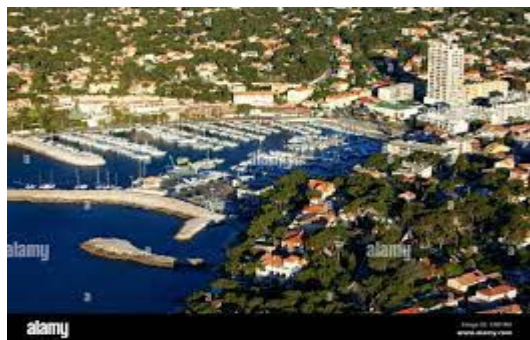
Carry le Rouet