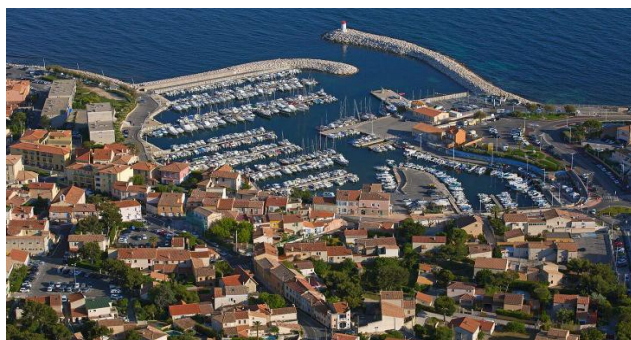
Sausset les Pins