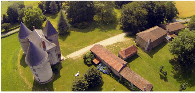
Château de Brie