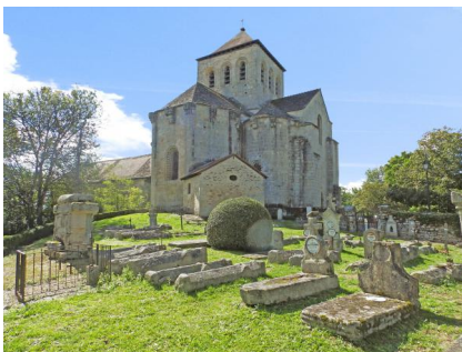
Eglise romane du Chalard

Notre route se poursuivra en Périgord vert, à Jumilhac le Grand où nous visiterons son imposant château du XIIème siècle situé au cœur des gorges de l'Isle et entouré de ses jardins à la française.