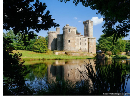
Château de Montbrun

Nous passerons devant les ruines du château de Lastours pour gagner le bourg de Saint Hilaire les Places où nous déjeunerons au restaurant le Saint Hilaire, 1 Rue des places.