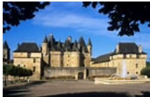
Château de Jumilhac

Ensuite notre route nous mènera au château de la Brègère (situé à 7 km de Saint-Yrieix la Perche) dans un ancien domaine agricole avec sa maison fortifiée du XVème siècle illustrant l'histoire d'une modeste dynastie seigneuriale limousine.