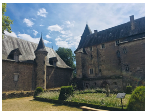
Château de Pompadour

Notre périple se terminera au pied du château médiéval de Pompadour, reconstruit au XVème siècle et remanié au XVIIIème siècle. Il fut offert, en 1745, à la favorite de Louis XV, Madame la Marquise de Pompadour qui créa le Haras de Pompadour.