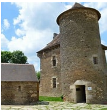
Château de la Bregère