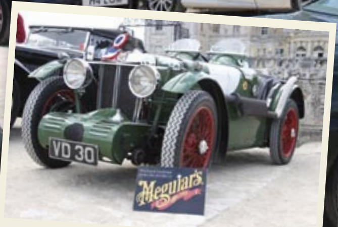
Type C de 1931 de Barry Foster