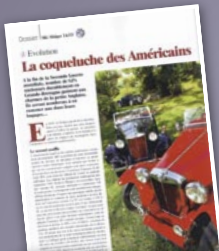
MG Midget TA/TF dossier de 16 pages dans le numéro de décembre 2011 de Rétroviseur