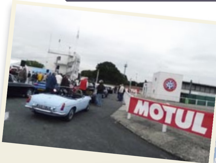
Entrée d'une MGB sur la piste