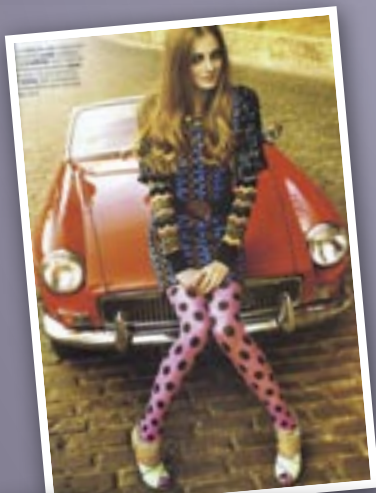
Neuf pages de photos avec MG dans le Biba Spécial mode d'octobre 2011