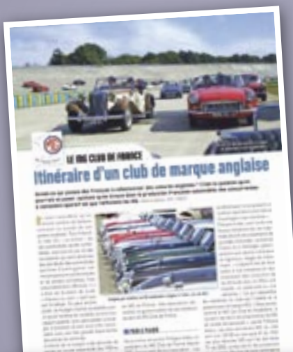
Trois pages sur le MGCF dans le numéro d'été 2011 de l'Authentique (magazine de la FFVE)