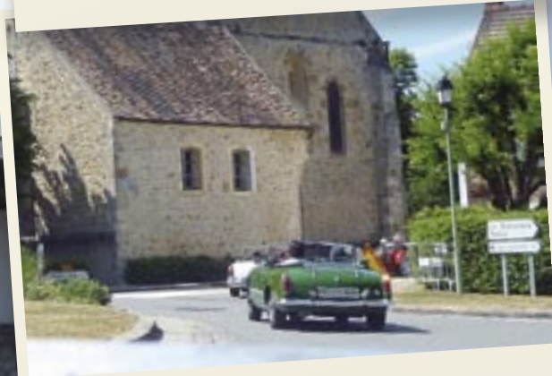
Balade du vendredi en Essonne