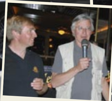
Remise des prix au relais des Chartreux