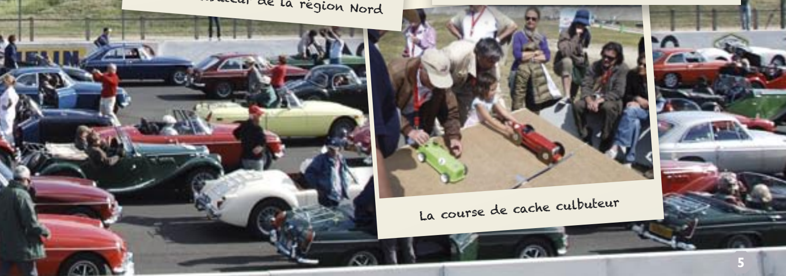
La course de cache cultbuteur