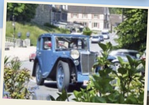
MG L1 Saloonette venue de Belgique