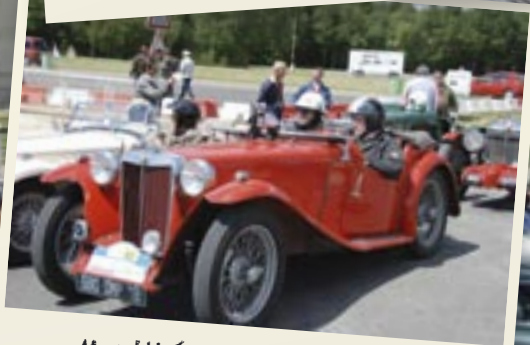
Montlhéry - TB de Xavier en pré grille