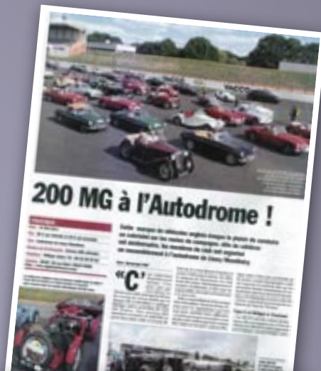
Les 30 ans du MGCF dans le numéro du 26 mai 2011 de LVA