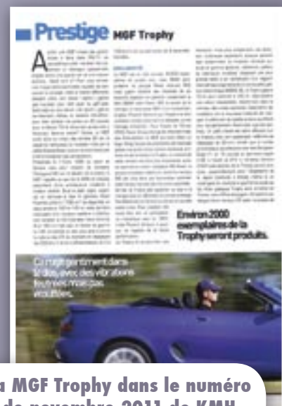
La MGF Trophy dans le numéro de novembre 2011 de KMH