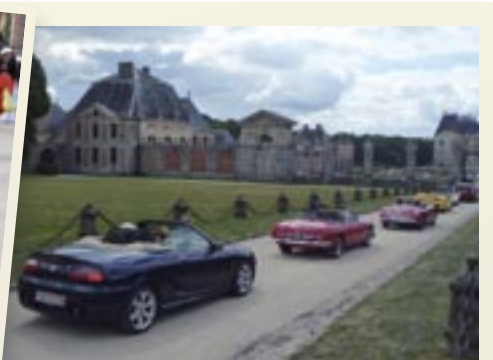
Arrivée au château