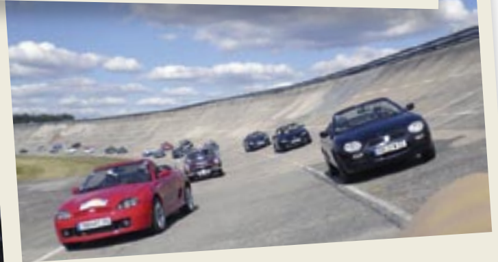
Plateau de MG modernes sur la piste