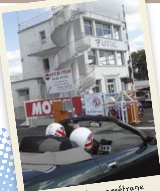
Tour de chronométrage de Montlhéry