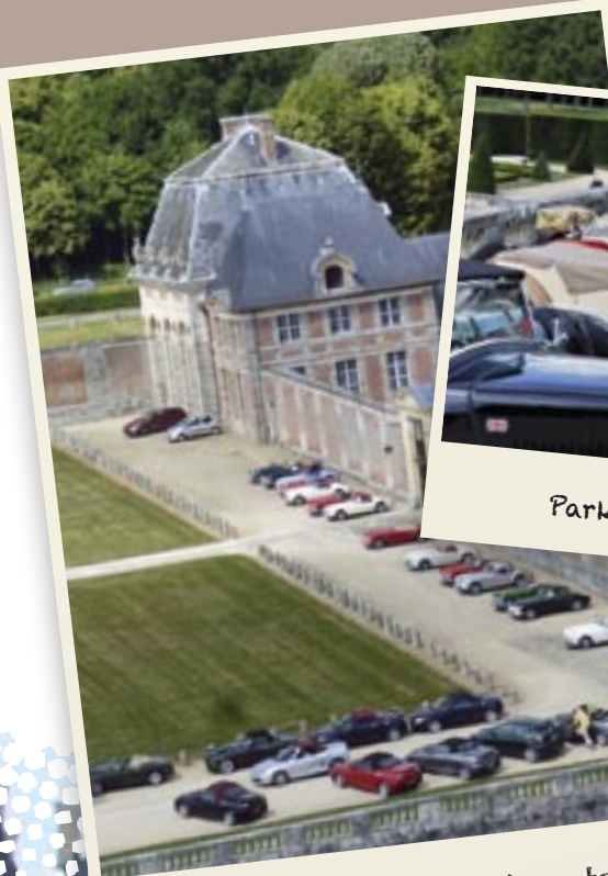
Château de Vaux le Vicomte