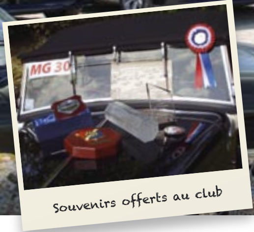
Souvenirs offerts au club