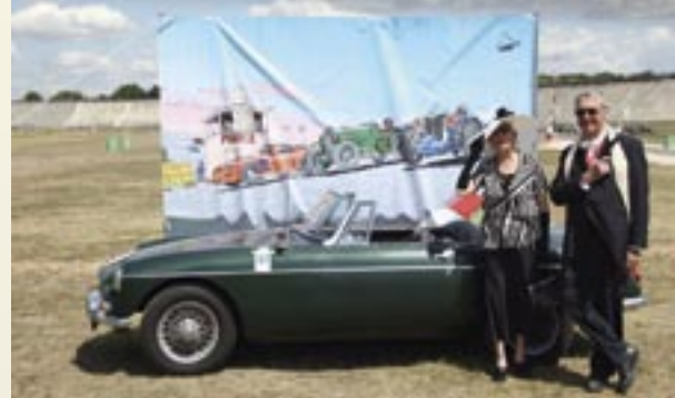
Concours d'élégance - James Bond 007