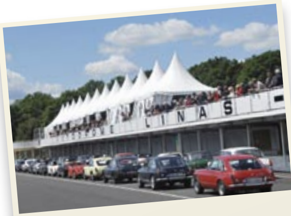
Les stands de l'autodrome