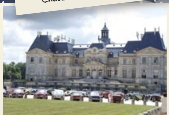
Parking des Séries B