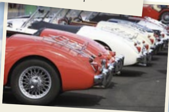
Plateau des MGA