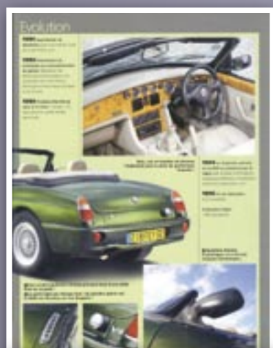
MG RV8 dans le numéro d'octobre 2011 d'Autoretro