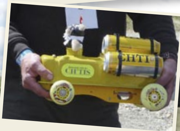
Cache cultbuteur de la région Nord