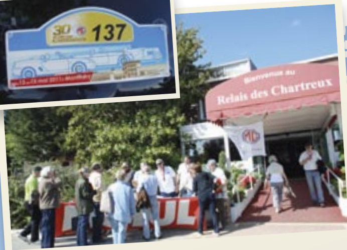
Accueil au relais des Chartreux