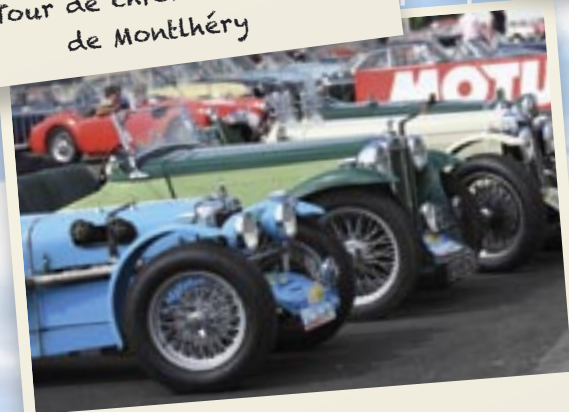
Paddock des MMM