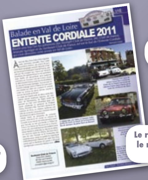
Le rallye de l'entente cordiale dans le numéro de novembre-décembre 2011 de Rétro Passion