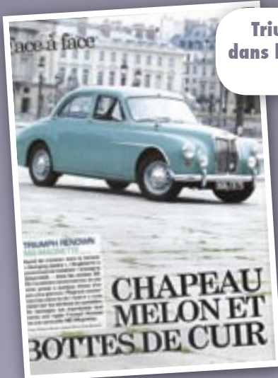
Triump renown MG Magnette dans le numéro de décembre 2011 d'Auto Collector