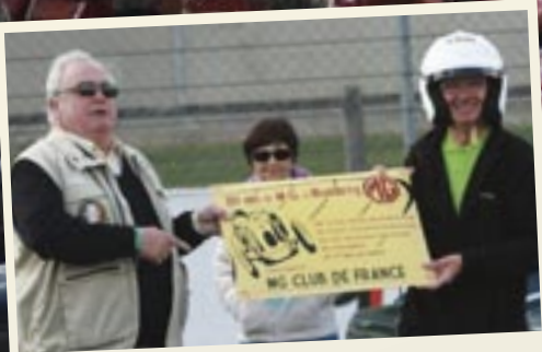
Le MGCF offre une plaque commémorative à l'UTAC