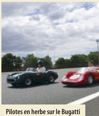
Pilotes en herbe sur le Bugatti