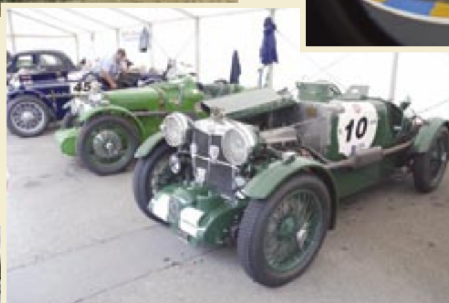
Beau paddock avec 2 MG K3 et une MG type C