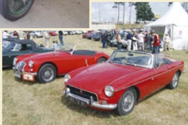
Toutes les MG sont éligibles au Mans classic : anciennes et modernes