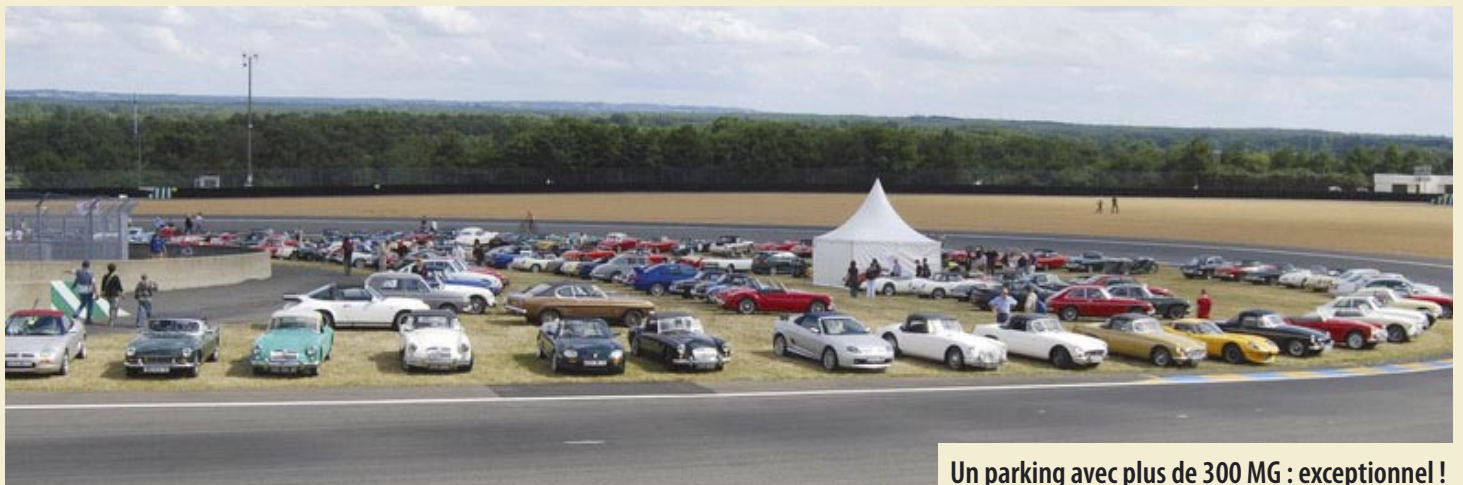
Un parking avec plus de 300 MG : exceptionnel !