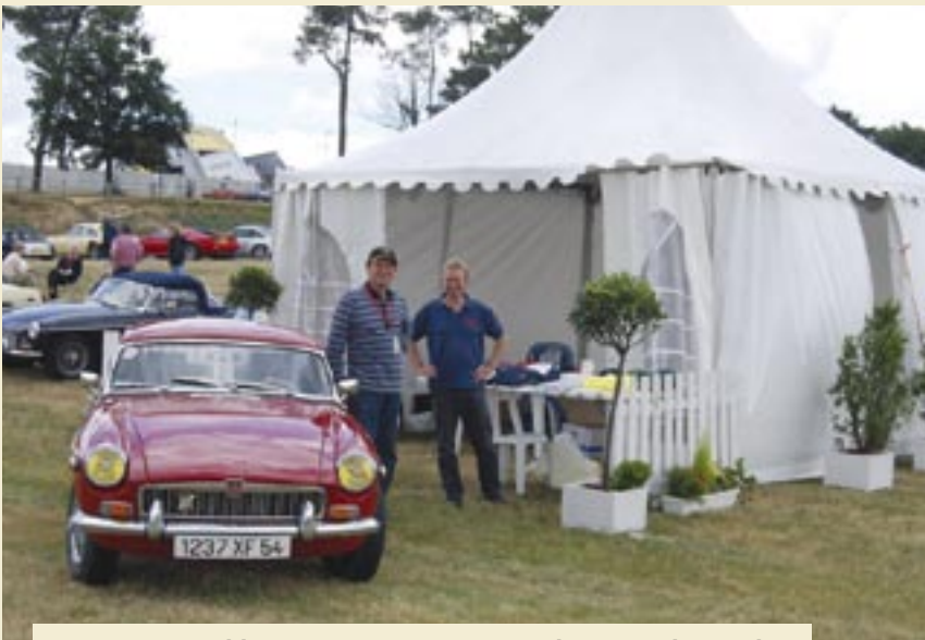
Les responsables régionaux sont venus aider à tenir le stand