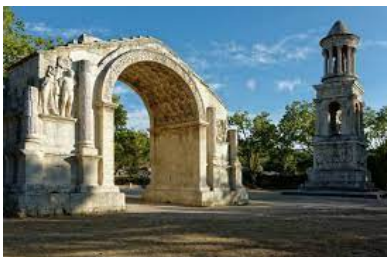
Les Antiques ( Saint Rémy de Provence)