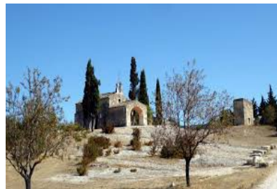
Chapelle Saint Sixte ( Eygalières )