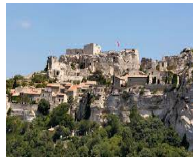
Les Baux de Provence