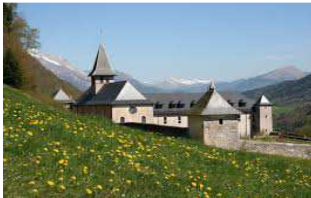
Abbaye de Tamié (V3)