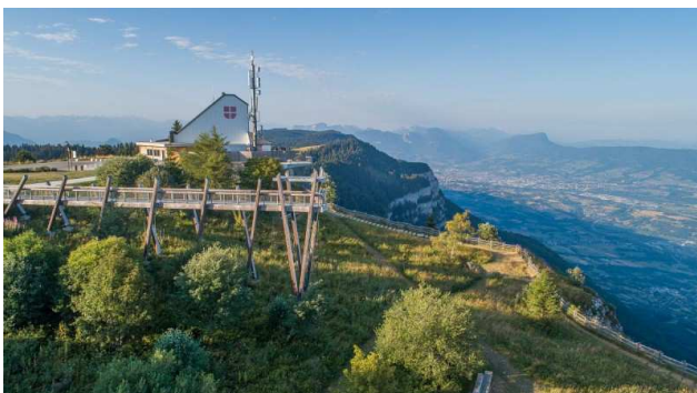
Belvédère du Revard (V4)