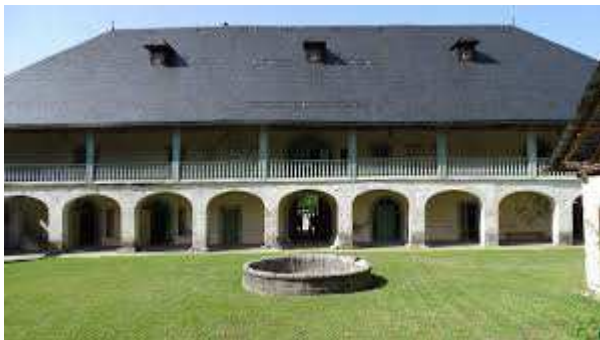
Chartreuse des Aillons (V2)