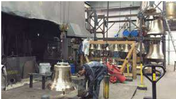
Fonderie PACCARD (V1)

Visite Guidée des Ateliers : Vidéo + Visite commentée du Musée + Visite Guidée des Ateliers , concert Ars Sonora de 20 cloches