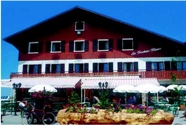
Hôtel les Rochers Blancs